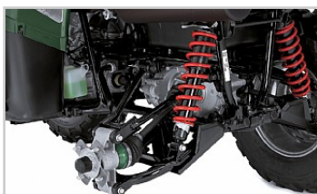
Pružiny s dvojí charakteristikou