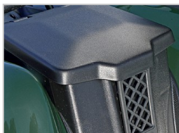
Vodě odolný úložný prostor